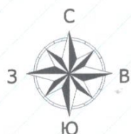
Схема планировочной организации земельного участка М 1:500